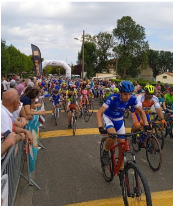
Départ de la dernière étape du Tour Poitou-Charentes 2022 : les jeunes devant les professionnels.

Voir ci-dessous quelques images de cette matinée.