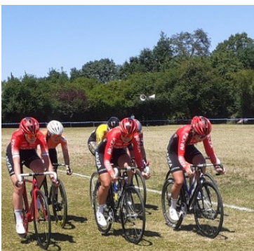
Une Route pour Tous à Champagnolles (17) avec les anciens cyclistes du Poitou-Charentes

Les 100 ans du vélodrome des Acacias à Champagnolles (17). Une fête très réussie. Les organisateurs et les bénévoles ont bien mérité un tel succès et voient leurs efforts ainsi récompensés. Un rendez-vous cycliste par un soleil magnifique avec un public nombreux et une piste idéalement damée après la pluie de la semaine passée.